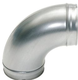
Coude 90° embouti

Le coude 90° permet de changer la direction d'un réseau galvanisé de 90°.